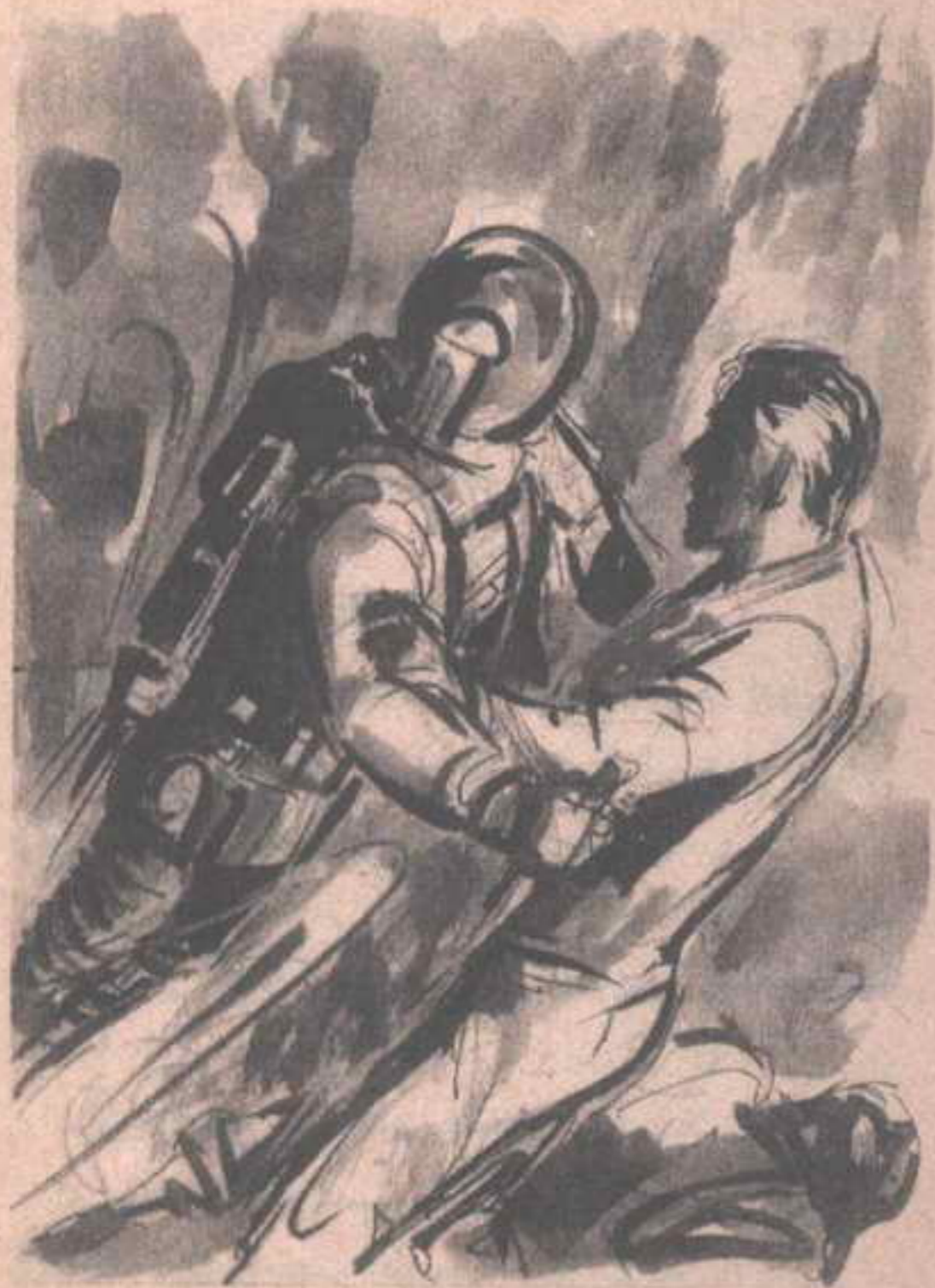
في نفس اللحظة ، التي وثب فيها (أدهم) .. كانت هي تحاول الارتفاع بزيها ، عندما تعلق بها بغتة ..

انفجر الخنجر حتى مقبضه في عنق (بترو) ، فحفظت عيناه عن آخرهما ، وتخاذلت ذراعاه ، المتشبثتين بجسدها ، فهوى ليرتطم بالأرض في عنف ..