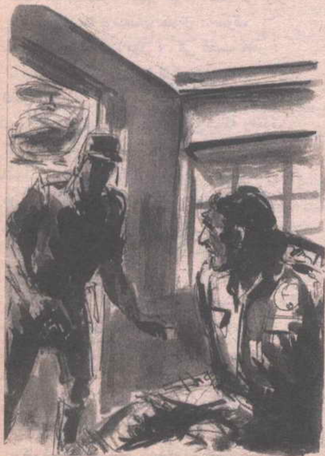
اتسعت عين الجنرال (دياز) في غضب ، وراح يقاوم قيوده ..

- هربوا .. اللعنة ! لا يمكن أن يهربوا من ( دياز ) .. لا يمكن .. أوقفوهم بأي ثمن .. بأي ثمن .